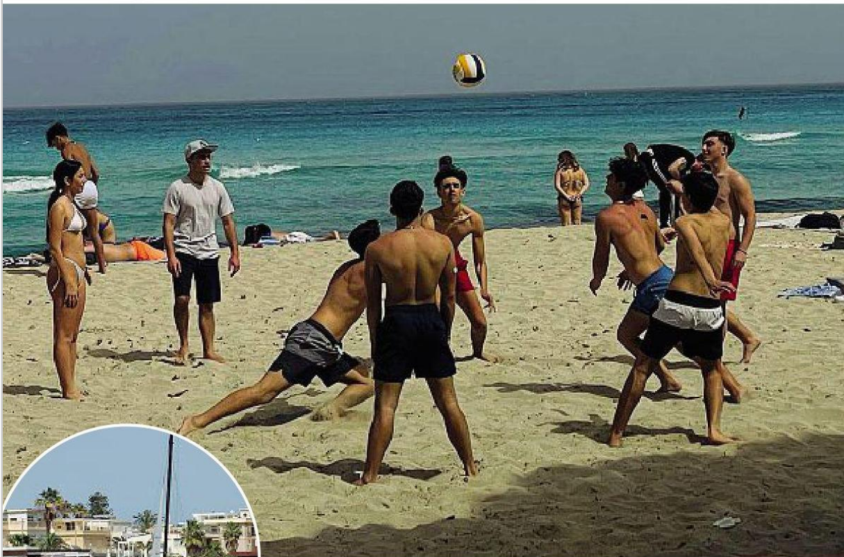
Al sole Giovani ieri sulla spiaggia di Mondello (Sirignano) Nel tondo, la spiaggia del Poetto a Cagliari