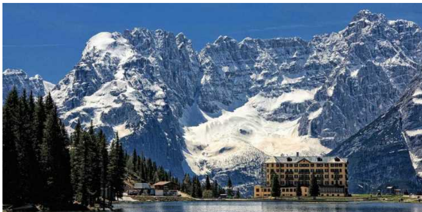
Dolomiti. Il gruppo del Sorapiss, da Misurina

Alberto Beggiolini — Pubblicato 25 Novembre 2024