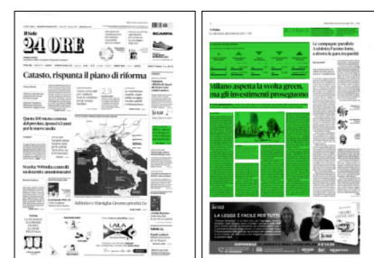
Superficie 43 %

Milano, con uno smart working che dovrebbe rimanere almeno al 40% in modo permanente, potrebbe cambiare radicalmente volto nei prossimi anni: non ci saranno solo grandi quartieri che riuniscono molti lavoratori, collocati prolepti nei grattacieli sorti negli ultimi anni, ma i quartieri più piccoli e periferici potrebbero rianimarsi anche durante il giorno. Si dovrà dunque ripensare anche alla vivibilità di questi spazi, e dovrà essere governata la "transizione" che questo comporterà nel campo dei servizi e del commercio, con un Comune impegnato a facilitare